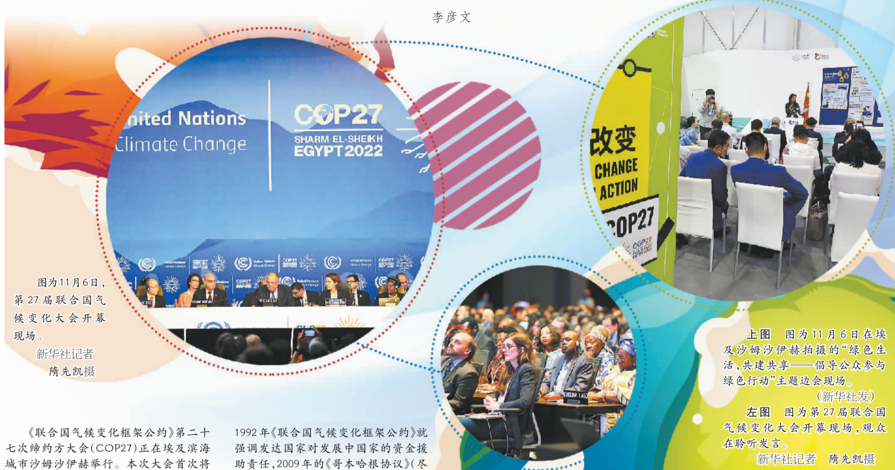
图为11月6日，第27届联合国气候变化大会开幕现场。