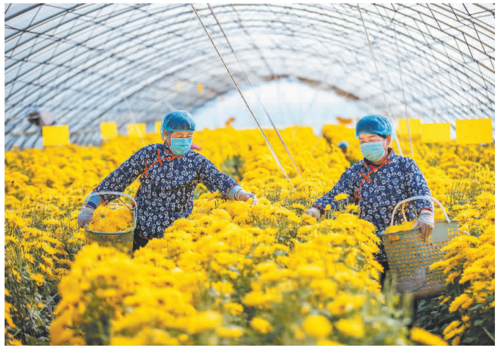
11月13日,山西省运城市夏县禹王镇郭里村村民在设施大棚收获金丝皇菊。近年来,夏县立足地理环境和气候优势,采取“公司+合作社+基地+农户”方式,发展观赏性强、经济价值高的金丝皇菊种植,通过打造精品菊花展,形成采摘体验、观光旅游、科普研学等多种业态,延伸菊花产业链,实现农民增收。