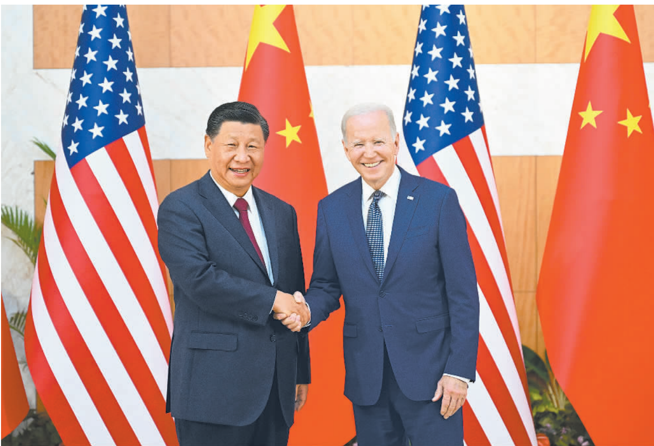
当地时间11月14日下午,国家主席习近平在印度尼西亚巴厘岛同美国总统拜登举行会晤。

本报印度尼西亚巴厘岛11月14日讯(记者陈小方)当地时间11月14日下午,国家主席习近平在印度尼西亚巴厘岛同美国总统拜登举行会晤。两国元首就中美关系中的战略性问题以及重大全球和地区问题坦诚深入交换了看法。