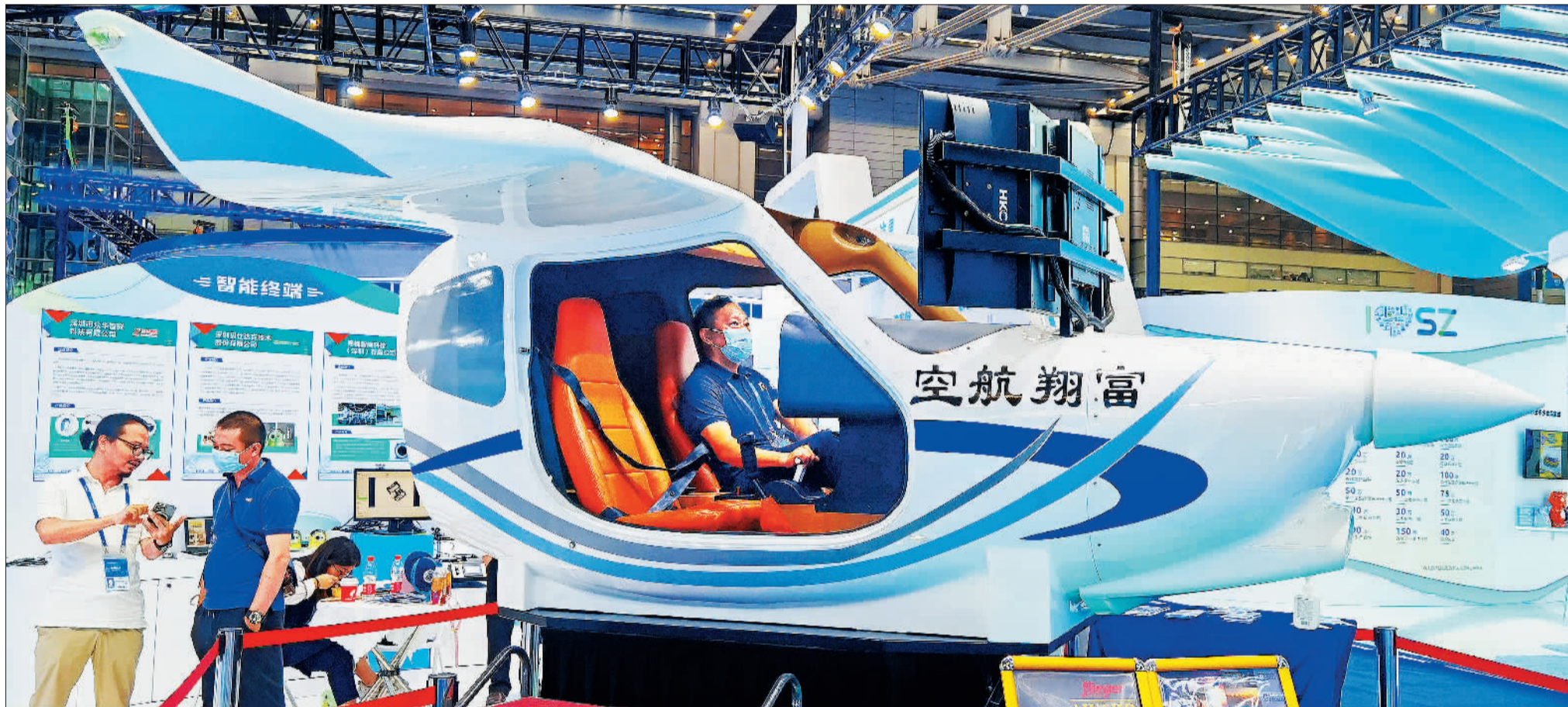
▲本届高交会上，市民在体验由深圳富翔航空科技有限公司研发的六轴动态飞行模拟器。该飞行器运用AR技术，为观众带来沉浸式航空体验。