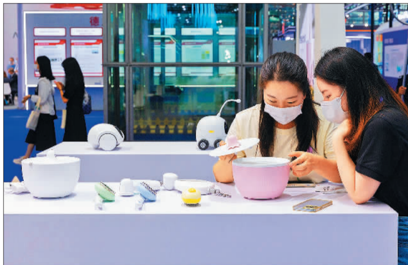
▶高交会深圳会展中心智能伴宠新生活展区，一款宠物自动饮水机吸引了观众目光。