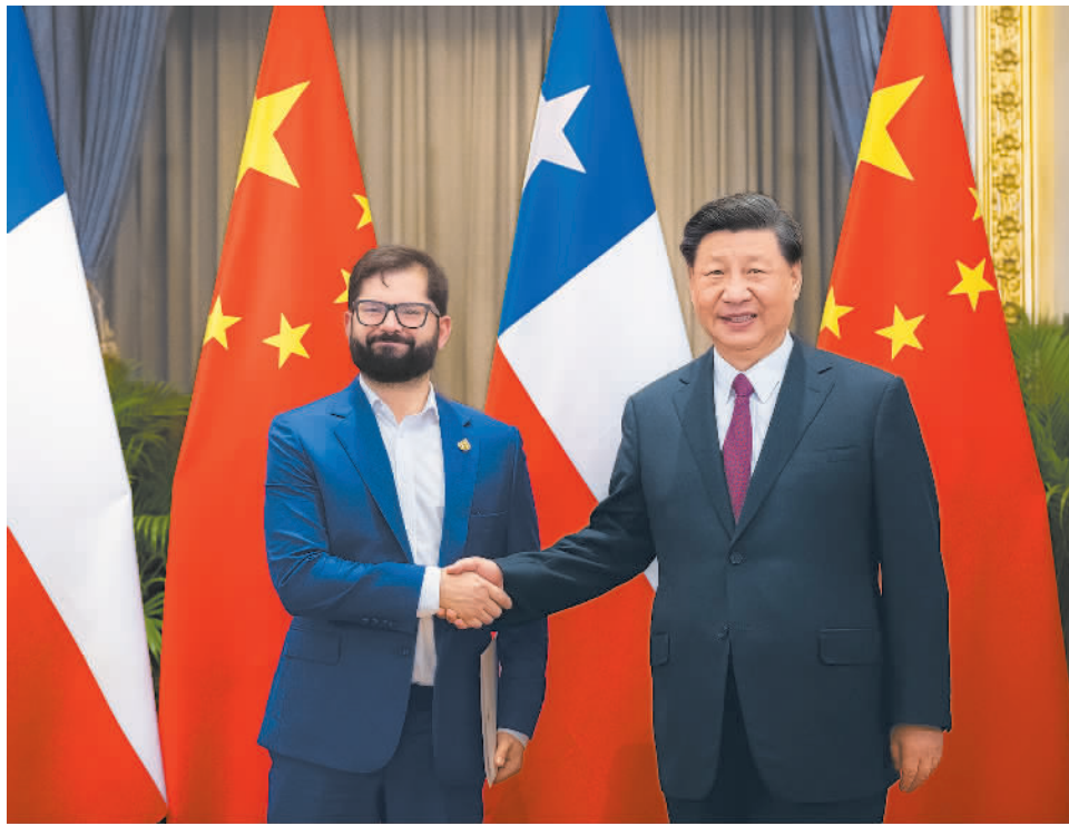
当地时间11月18日下午,国家主席习近平在泰国曼谷会见智利总统博里奇。