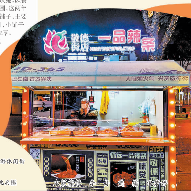
图为敬德街旅游休闲街区的小铺子。

记者看到,小铺子从消费者需求出发,满足现代社会的快节奏生活,节省用餐时间,为当下年轻人提供健康食品,且带来的新美食具有差异化,容易吸引顾客,获得较高溢价。不仅如此,美食小铺子还弥补了一些“高大上”街区烟火气的不足,起到了引流客、聚人气的作用。