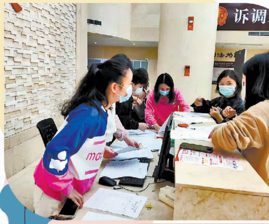
上图 重庆市长寿区消委会支持114名消费者诉聆音能童少儿艺术培训中心教育培训合同纠纷案。图为长寿区消委会工作人员在法院协助消费者递交相关法律文书。(资料图片)

为维护消费者利益,吉林省消费者协会积极探索建立集体诉讼工作机制,加强同人民法院协作,在处理预付卡消费纠纷中,通过支持集体诉讼为消费者挽回经济损失。据统计,2021年广东省支持消费者诉讼案件682宗,其中不乏支持预付式消费集体诉讼、批量代理支持消费者诉讼等典型案例。