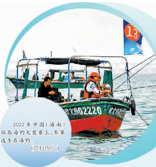
2022年中国(海南)环岛海钓大奖赛上，参赛选手在海钓。(资料图片)

露营经济的持续健康发展终究需要政府和市场共同发力。如今，政策的出台已经为市场吹来“春风”，接下来，就要看各地和企业如何顺势而为了。