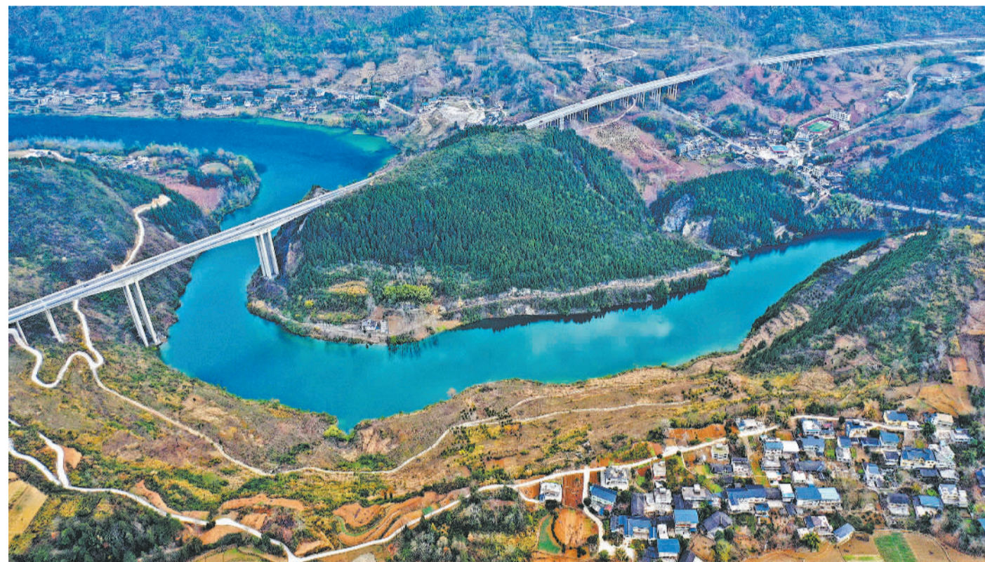
2022年12月30日,汽车行驶在重庆市黔江区渝湘高速阿蓬江特大桥上。近年来,重庆市黔江区加快建设高速公路,相继建成渝湘(重庆至湘西)、黔恩(重庆黔江至湖北恩施)、石黔(重庆石柱至黔江)高速公路和黔江过境高速公路,这一高速公路网成为连接湖北、湖南、重庆的重要交通枢纽,有力推动了武陵山区乡村振兴和经济社会发展。

普京总统向习近平主席致以衷心的节日祝贺,祝愿友好的中国人民幸福安康。普京表示,在即将过去的一年里,俄中全面战略协作伙伴关系持续加强,展现出强劲发展势头,经受住外部挑战考验。两国政治对话内容丰富,双边贸易额创历史新高,重大跨境交通基础设施项目建设完工。俄中体育交流年顺利举办,为推动双方人文合作作出重要贡献。