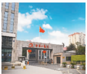
1996年6月迁入北京西城区白纸坊东街2号院。

经济日报社始终坚持党建工作和业务工作同向、部署同步、工作同力,以系统思维推动党建工作和业务工作深度融合发展。