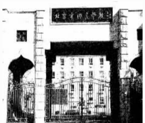
创刊初期至1984年7月,在北京广安门内大街回民中学院内置地租房。