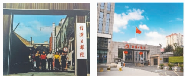
1984年7月迁入北京东城区王府井大街277号1号院。