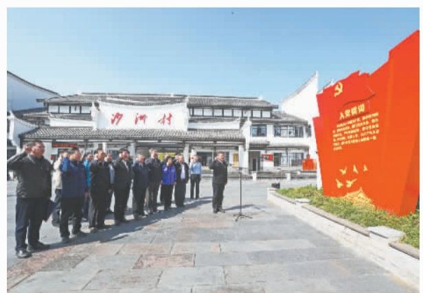
2019年11月,经济日报社编委会赴湖南省郴州市汝城县沙洲村开展主题党日活动。

1983年创刊初期,有中共党员132人,机关党委下设7个党支部。截至2022年7月,经济日报社及社属单位有中共党员1209人,其中在职807人。机关党委有基层党组织32个,下设党总支、党支部74个。