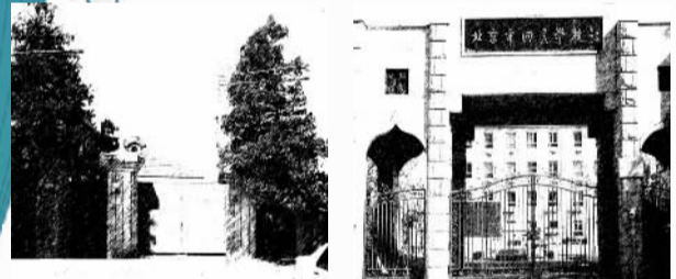
《中国财贸报》时期至1984年7月,在北京西黄城根南街9号院租房办报。