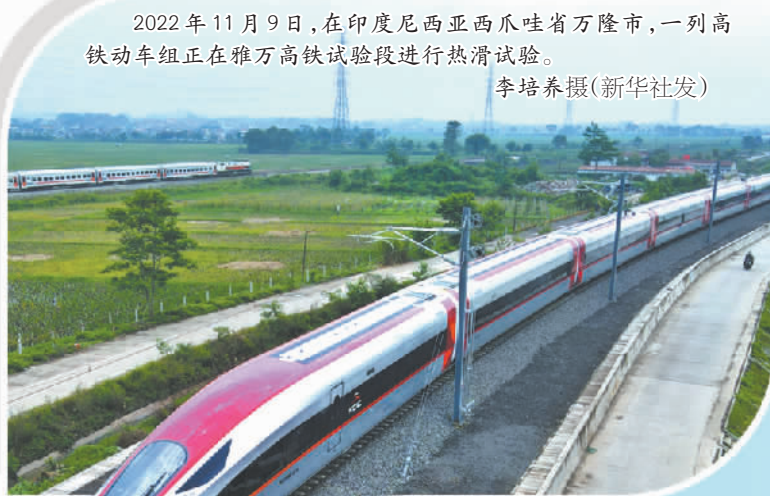
2022年11月9日，在印度尼西亚西爪哇省万隆市，一列高铁动车组正在雅万高铁试验段进行热滑试验。

过去一年，从“一起向未来”的北京冬奥会和冬残奥会，到“共促全球发展，构建共同未来”的博鳌亚洲论坛，从“构建新时代全球发展伙伴关系，携手落实2030年可持续发展议程”的全球发展高层对话会，到“新时代，共享未来”的第五届中国国际进口博览会，从“共同复苏、强劲复苏”的二十国集团(G20)巴厘岛峰会，再到“开