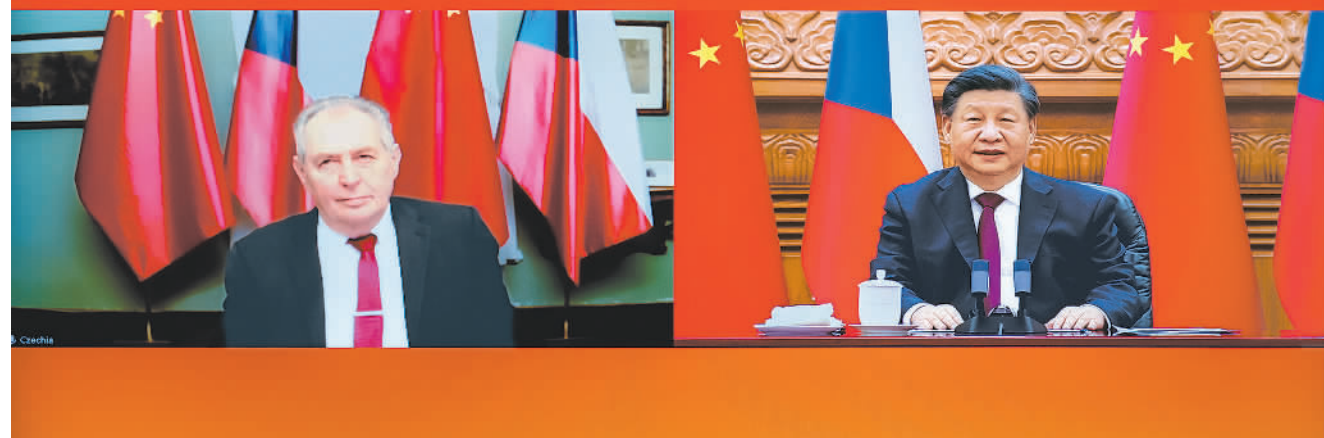
1月9日下午,国家主席习近平在北京同捷克总统泽曼举行视频会晤。

习近平主席同捷克总统泽曼视频会晤 Video setkání prezidenta Xi Jinping a prezidenta Miloše Zemana