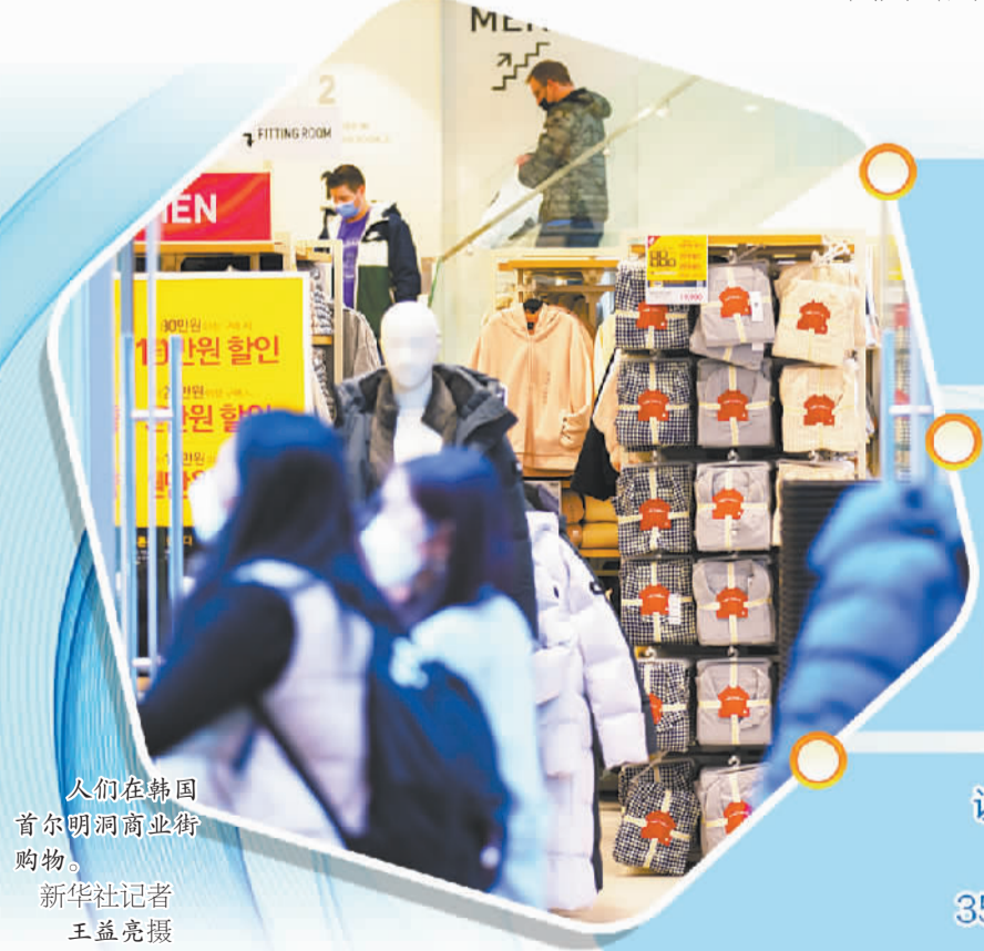
人们在韩国首尔明洞商业街购物。