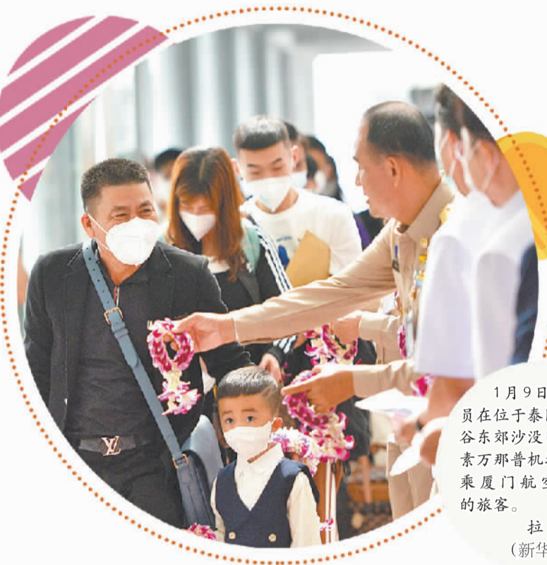
1月9日，泰国官员在位于泰国曼谷曼谷沙巴巴府的素万那普机场欢迎搭乘厦航MF833的旅客。

一是美欧经济增长放缓带来的出口增长困难。受供需两方面因素影响，美国和欧洲正经历几十年来最严重的通货膨胀，美欧货币当局采取少有的紧缩货币政策，却不可避免地降低了总需求，使经济衰退概率大增，也给高度依赖出口的亚洲经济带来巨大压力。国际货币基金组织预测2023年美国和欧元区的