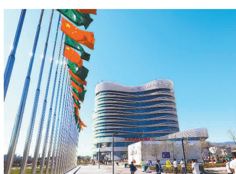
1月11日，中国援非盟非洲疾病预防控制中心总部(一期)项目正式竣工。这是当天在埃塞俄比亚首都亚的斯亚贝巴拍摄的非洲疾控中心总部大楼。

与此同时，中国土木时刻不忘履行社会责任，积极回馈当地社会，在当地树立了依法合规、诚信经营、积极履责、勇于担当的中国企业形象，以实际行动推动构建新时代中非命运共同体。在项目施工的高峰期，公司曾聘用近千名当地工人，并安排中国师傅有针对性地开展培训，这不仅有效带动了当地就业，还培养了一大批掌握技术的熟练工人，得到当地社会高度认可。