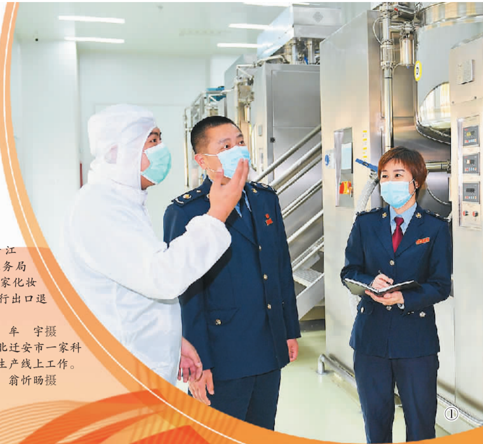
图① 浙江湖州吴兴区税务局工作人员为一家化妆品生产企业进行出口退税上门辅导。