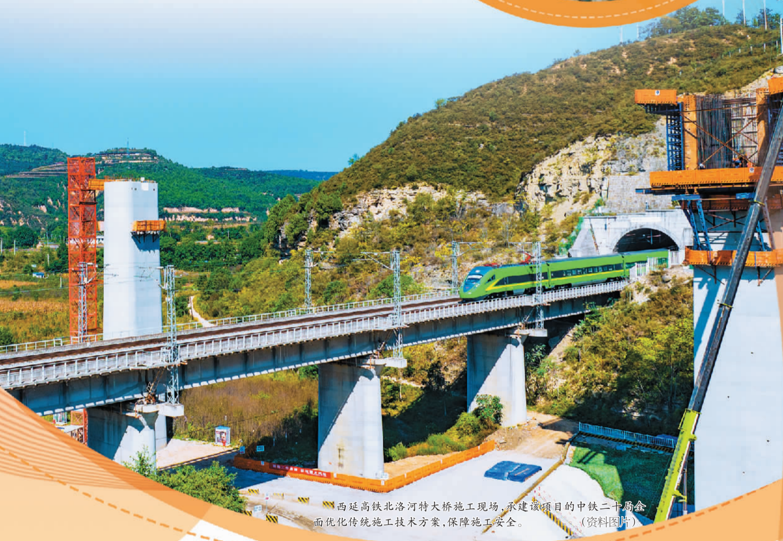
西延高铁北洛河特大桥施工现场，承建该项目的中铁二十局全面优化传统施工技术方案，保障施工安全。