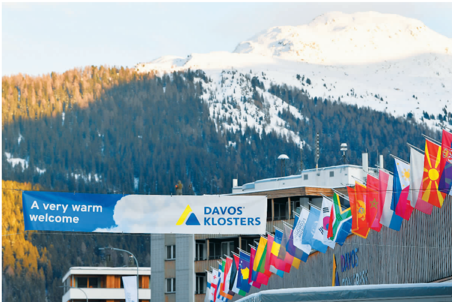
图为1月16日在瑞士达沃斯拍摄的达沃斯会议中心外景。