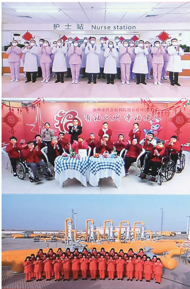
1月18日,中共中央总书记、国家主席、中央军委主席习近平在北京通过视频连线看望慰问基层干部群众,向全国各族人民致以新春的美好祝福(拼版照片)。

视频连线镜头切换到福建省福州市社会福利院,在院老人和护理人员纷纷向总书记问好,习近平给大家拜年。他仔细询问福利院生活和医疗条件、疫情防控和老年人疫苗接种情况,并同在院老人聊起身体状况、日常生活,嘱咐他们保重身体。当得知这里伙食品种丰富,药品储备充足,对有基础病的老人加强了日常健康监测,节前备足了年货,习近平十分高兴。老人们拿出亲手制作的剪纸“福”字,向总书记献上真诚的祝福,习近平表示感谢。他强调,当前,病毒仍在不断变异,这一波疫情虽然毒性有所减轻,但传播更快、传染性更强,对老年人风险很大,我特别关