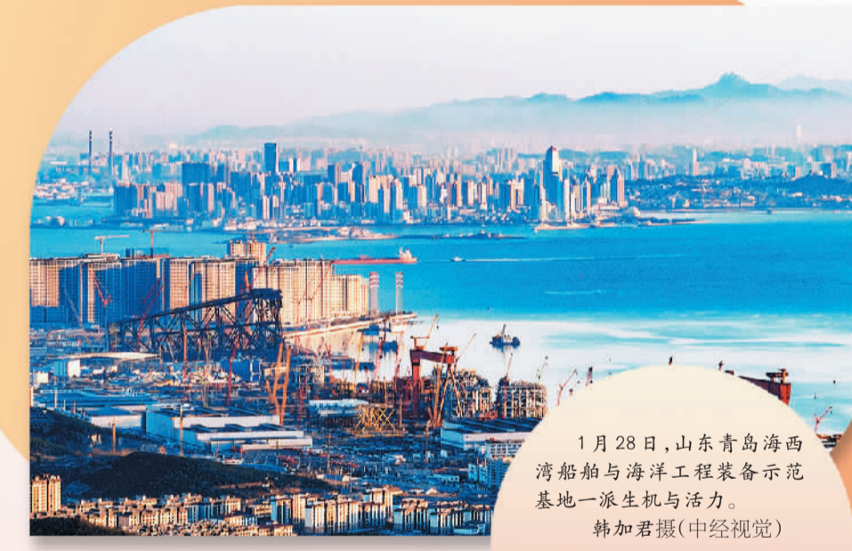
1月28日，山东青岛海西湾船舶与海洋工程装备示范基地一派生机与活力。