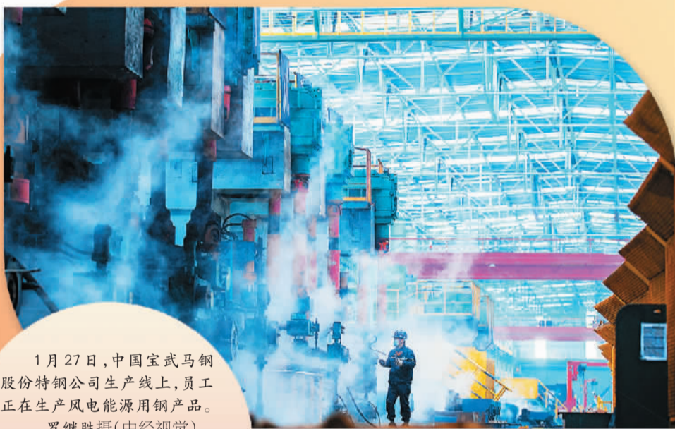
1月27日，中国宝武马钢股份特钢公司生产线上，员工正在生产风电能源用钢产品。