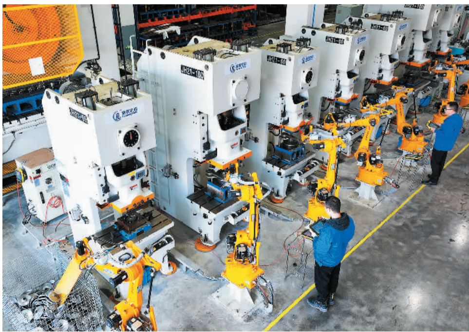
1月29日，在浙江省湖州市德清县钟管镇的浙江南泵流体机械有限公司生产车间内，工人在赶制水泵零配件。

对于地方来说，要想赢得游客的心，不仅需要美好的自然环境和具有特色的地方文化，更需要营造公平合理、放心舒心的消费环境，打造放心消费城市名片，让消费者乘兴而来，尽兴而去。如果不能严查价格违法或者消费欺诈行为，及时回应社会关切，再美的景色，也留不住游客。