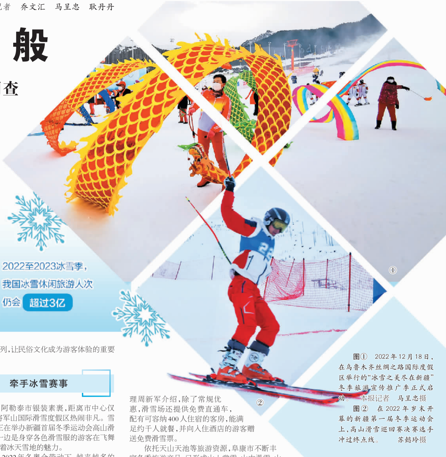
图① 2022年12月18日，在乌鲁木齐丝绸之路国际度假区举行的“冰雪之美尽在新疆”冬季旅游宣传推广季正式启动。