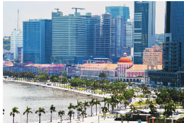
安哥拉首都罗安达街景。

会议通过的《达喀尔宣言》呼吁,非洲各国和各区域经济体应将非洲基础设施发展计划纳入其战略发展规划,并落实预算和筹资,加快吸引私人投资和改善营商环境。多边金融机构应放宽融资条件,包括降低利率、提高债务上限和预算赤字等。《宣言》同时呼吁,在“非洲发展新伙伴关系”框架内建立一个捐助信托基金,由非盟成员国提供资金,并由发展伙伴、融资机构、私营部门和多边开发银行提供捐款。