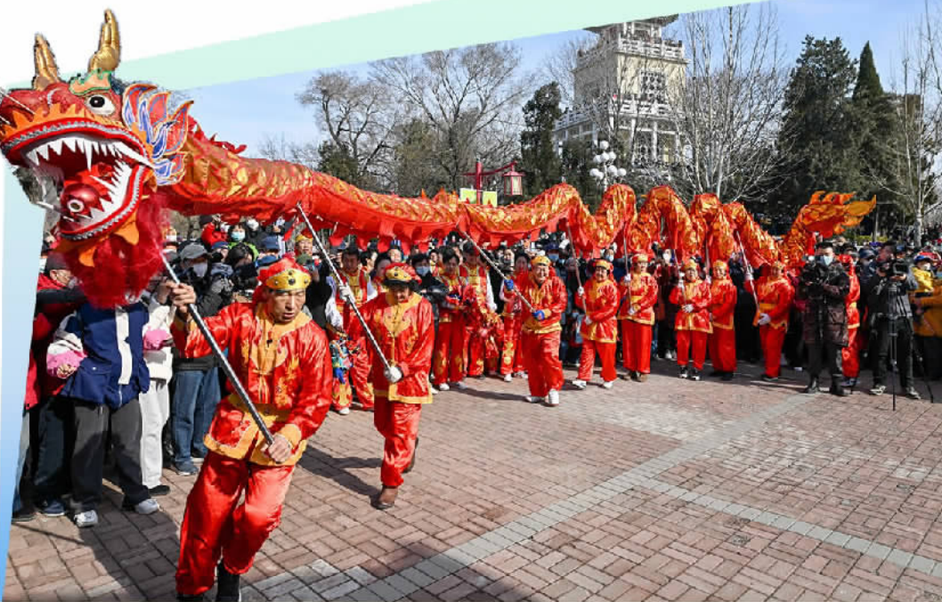
农历二月初二,民间艺人在天津市水上公园进行舞龙表演。