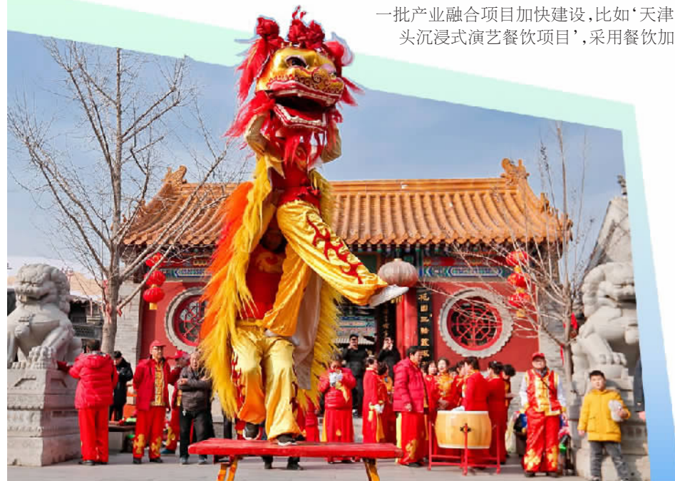
位于天津市西青区的杨柳青民俗文化街正在举办民俗文化和庙会活动。

“我们此次统筹了西青区优秀的传统文化和丰富的旅游资源,围绕着‘游美丽西青·过欢乐大年’的主题,推出了25项文旅活动。有这