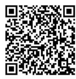
视频报道请扫二维码