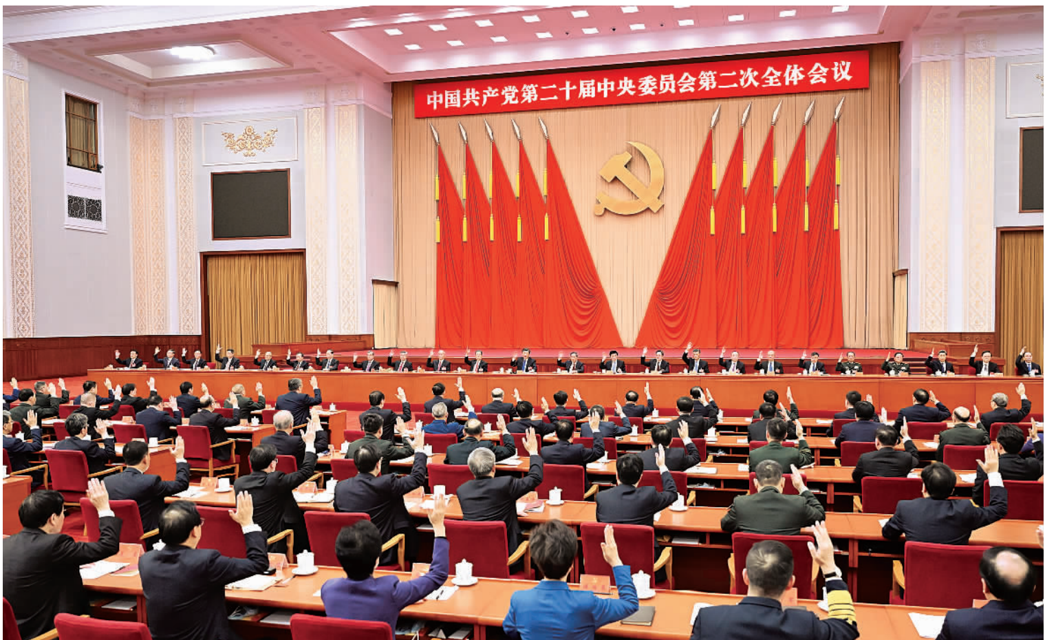
中国共产党第二十届中央委员会第二次全体会议,于2023年2月26日至28日在北京举行。中央委员会总书记习近平作重要讲话。