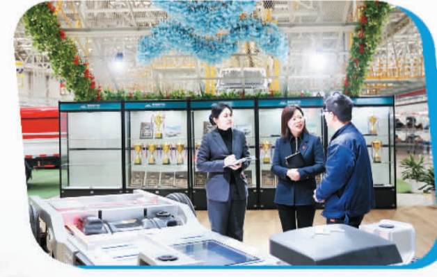
农业银行工作人员赴浙江新吉奥汽车生产车间实地调研