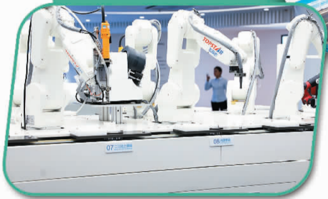
广州拓斯达科技股份有限公司