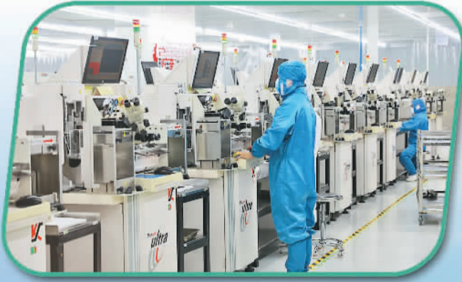
东莞海和科技有限公司