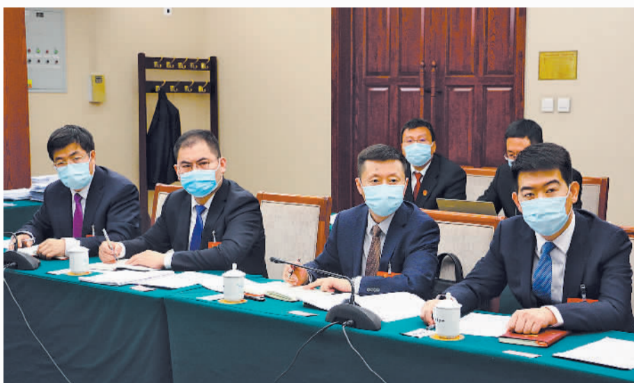
3月9日，十四届全国人大一次会议山西代表团举行小组会议，审议最高人民法院工作报告、最高人民检察院工作报告。

首先，将推进城市更新，增强城市包容性、承载力。其次，推进生态宜居，增强城市亲和力、吸引力。推进“水洞城”，打造以拉萨河为脉、辐射中心城区全域的水系大格局。积极创建国际湿地城市。推进“绿满城”，积极塑造“一街一树、一街一色、一街一景”，打造“城在林中、路在绿中、房在园中、人在景中”的高原生态宜居新城。再次，推进动能转换，增强城市内生力、辐射力。创新推进清洁能源、数字经济、绿色工业、现代服务业破题突围，推进“数兴城”，积极争取全国大型金融企业、通信企业将数据存储业务和算力中心向拉萨转移。