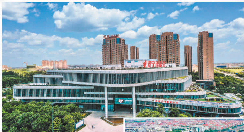
济宁高新区数创中心

春回大地，万物竞发，行走在山东济宁高新区，处处都能感受到高质量发展的活力与动能加速释放，城市生机焕发。2023年，济宁高新区将聚焦“1477”发展思路布局，扎实推进项目建设、产业发展、科技创新等重点工作，争当国家高新区高质量发展新典范。