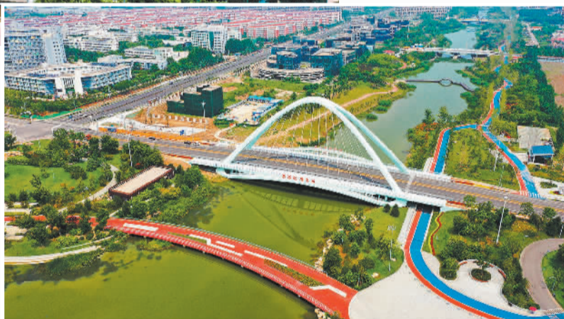
济宁高新区鸿雁湖公园

重点项目建设是稳定经济发展的重要抓手，济宁高新区坚持又高又新发展定位，聚力发展“七大主导产业”，以重点项目建设为牵引，带动区域高质量发展。今年济宁高新区将重点聚焦总投资1306亿元的181个“双百工程”项目建设，推动山推机械四产品生产线、铭德港城高端节能环保装备等技术升级项目建设，加快推进小松全球智能制造产业基地、海富电子光学盖板等重点项目开工建设，积极推动小松年产1万台四中大中型液压挖掘机和重卡生产基地、浩珂年产2000万平方米高强度智能装备制造等54个项目申报2023年省市重点项目。同时进一步完善项目协调推进机制，坚持“要素跟着项目走”，强化对重大项目支撑力度，确保项目快落地、快建设、快达效。