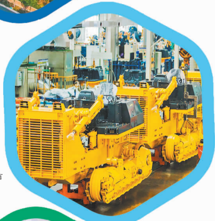
山推工程机械有限公司生产车间