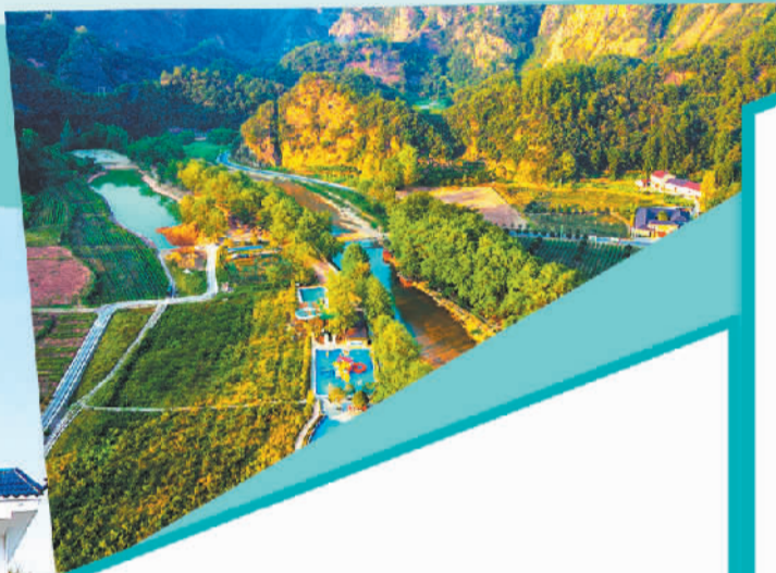
右图 湖北远安县旧县镇鹿苑村游乐园。