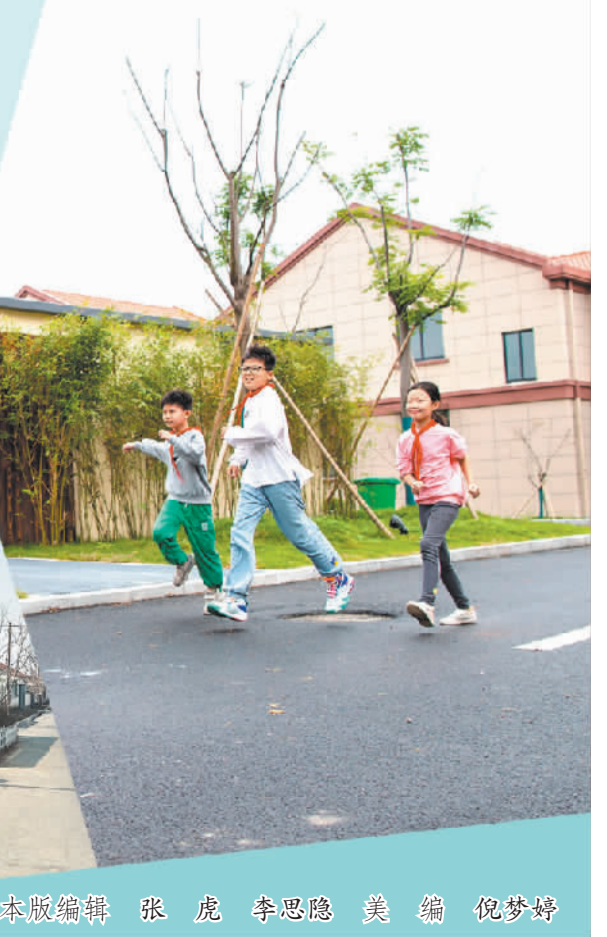
本版编辑 张虎 李思隐 美编 倪梦婷

通过投入大量资源,汉阴县切实改善了农村供水环境,提升了农民群众安全饮水质量,使得农村安全饮水工程建得成、管得好、用得起、长受益。据统计,该县的农村自来水普及率稳定在99.31%以上,农村供水保证率达到95%以上,水质达标率达到100%。