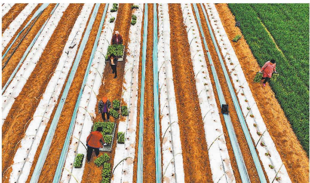
安徽省亳州市谯城区芦庙镇王楼村农民在田间移栽西瓜苗。近年来,亳州市不断优化农业产业结构,大力发展高效农业,扩大规模化瓜果、蔬菜种植面积,助力农业增效、农民增收。