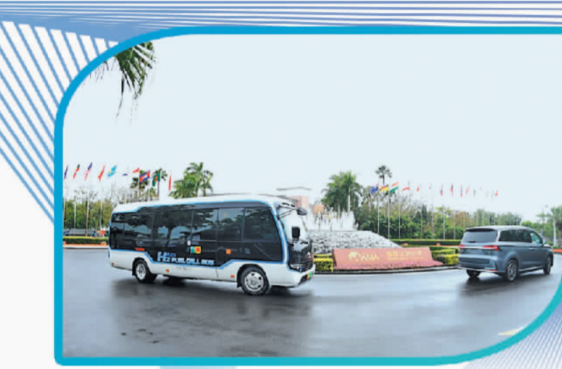
上图 3月28日，博鳌亚洲论坛会议中心外驶过新能源汽车。