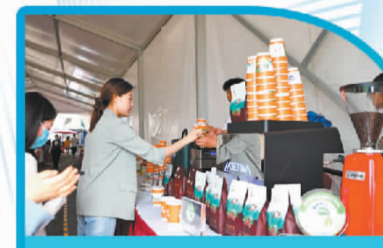
3月29日，记者在博鳌亚洲论坛新闻中心内体验“零碳”咖啡。