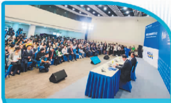
3月28日，博鳌亚洲论坛2023年年会新闻发布会暨旗舰报告发布会在海南博鳌举行。