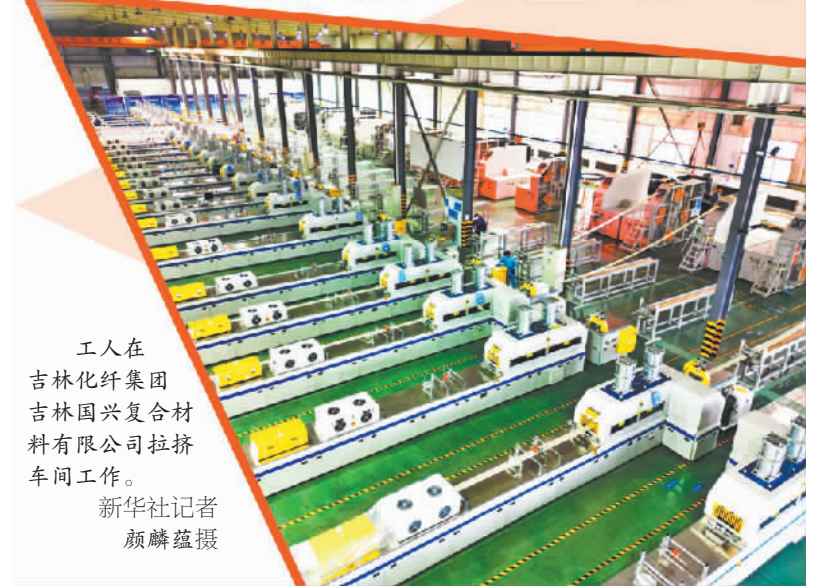
工人在吉林化纤集团吉林国兴复合材料有限公司拉挤车间工作。