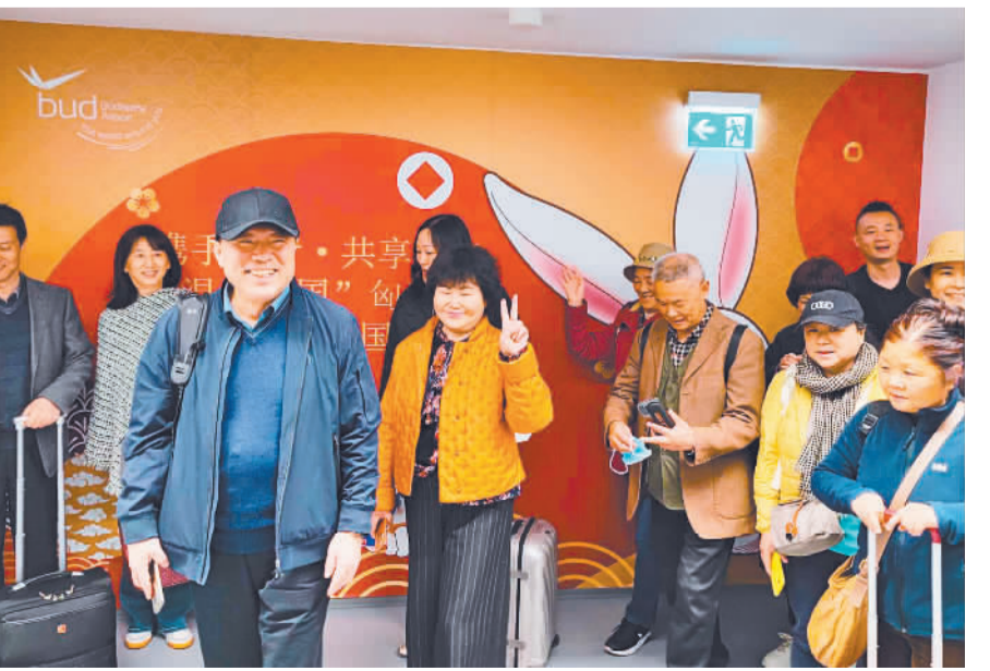
布达佩斯国际机场航站楼布置了“携手同行·共享未来，‘温泉之国’匈牙利热烈欢迎中国游客”海报。4月5日，中国旅行团从欢迎海报前走过。

105%。2019年，有将近28万名中国游客来到匈牙利旅游。按消费间夜量计算，中国在2019年是布达佩斯第九大客源市场。 匈牙利国家旅游局负责市场营销和外联事务的副局长雅各布·索菲娅表示，尽管中匈两国相距遥远，但中国一直是匈牙利旅游业最重要的客源市场之一，对匈牙利旅游业发展至关重要。随着中国游客回归，匈牙利旅游业有望在2023年取得良好发展，恢复至疫情前水平。 统计数据显示，2022年匈牙利旅游业吸引了约4630万名游客，同比增长26%，虽然距疫情前的2019年数据有近四分之一的差距，但匈牙利旅游市场重启步伐明显快于欧盟平均水平，旅游业继续处于上升通道中。 匈牙利国家旅游局重新修订了2030年旅游发展战略，希望通过保持旅游市场规模、制定旅游评级系统、推动向数字化转型以及加强旅游培训体系等措施，提高旅游业的抗风险能力和可持续发展能力，以期达到2030年匈牙利成为中欧领先的旅游目的地国家、旅游业对GDP贡献率达到16%的战略目标。