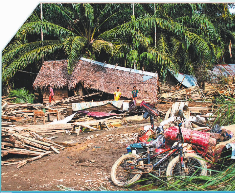
1月23日，印度尼西亚苏门答腊北亚齐地区遭遇洪水侵袭，孩子们站在受损的房屋旁。

气候变化带来的温室效应、极端天气及生态系统失衡是全球可持续发展面临的重大挑战。目前，资金仍是制约各国应对气候变化的重要因素。国际社会应进一步加强气候投融资国际协调，不断创新金融工具，既着眼当下又兼顾长远，合作应对气候变化。