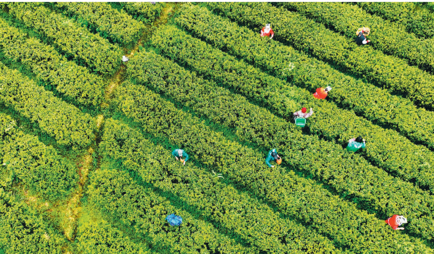
4月14日,在重庆市酉阳土家族苗族自治县五福镇五福村,村民在梭罗山茶园采摘春茶。近年来,该县大力培育发展绿色生态茶产业,目前,全县茶叶种植面积有6万多亩,成为农民增收致富的绿色银行。

铜仁市相关负责人表示,将精心搭建便捷的融资对接平台,常态化举办政金企融资对接活动,促进资金需求与金融政策有效衔接,进一步提高对接成功率、项目落地率、资金到位率,促进当地六大主导产业高质量发展。