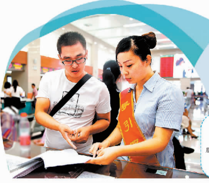
银川市民大厅导办工作人员服务现场。

“银川市政企通平台去年下半年测试时,我们企业就把相关信息对接到这个平台上了。”宁夏梦驼铃科技有限公司财务经