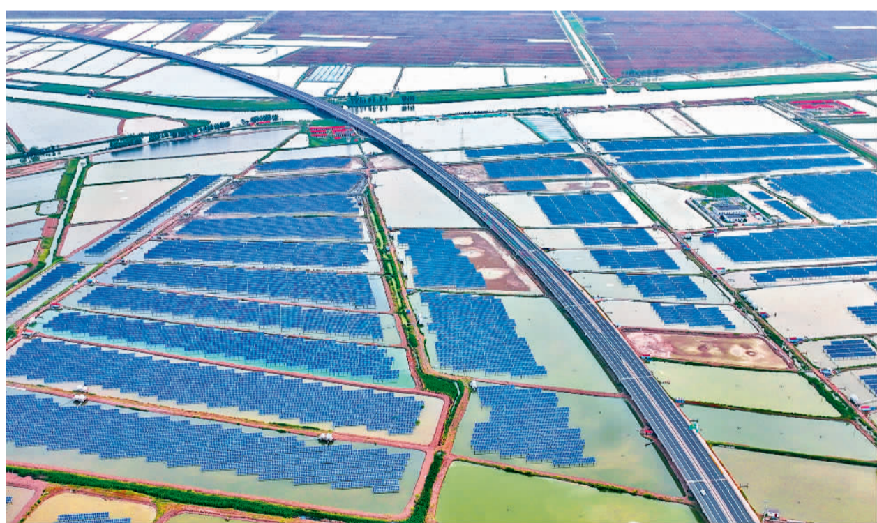
近年来,江苏连云港市充分利用荒地、屋顶、沿海滩涂等有序开发建设太阳能光伏、风力发电等绿色能源项目,全力打造“阳光工程”,在保护环境的同时,实现了经济、生态和社会效益的有机统一。图为5月15日拍摄的连云港市沿海滩涂上一座光伏发电站。

近年来,银川市政务服务对标一流,软环境越来越好,市场氛围越来越浓。尽管受疫情影响,银川市新开办企业年均增速仍达到15%,经营主体保有量达到36.4万户,创业密度持续增长、创新活力持续迸发,2022年9月获评“中国投资热点城市”。