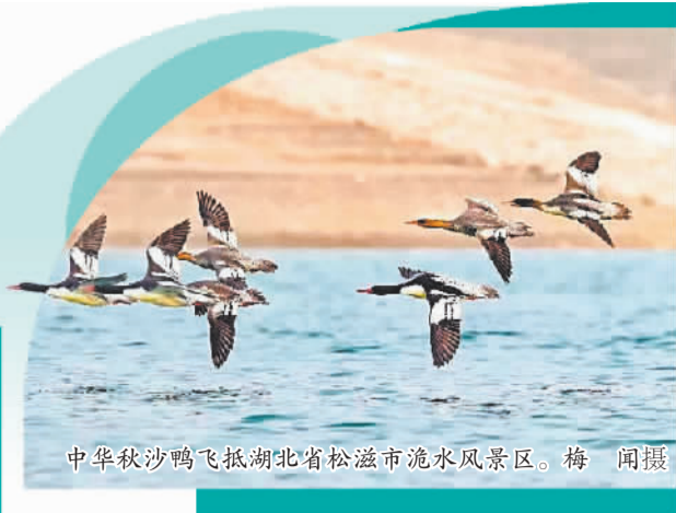
中华秋沙鸭飞抵湖北省松滋市流水风景区。

“回家咯！”近日，4头长江江豚在湖北省荆州市放归长江。游向远方的它们，时而探出头来，向守望在岸边的人们“微笑”。这是长江江豚实施迁地保护30多年来，首次野化放归长江。