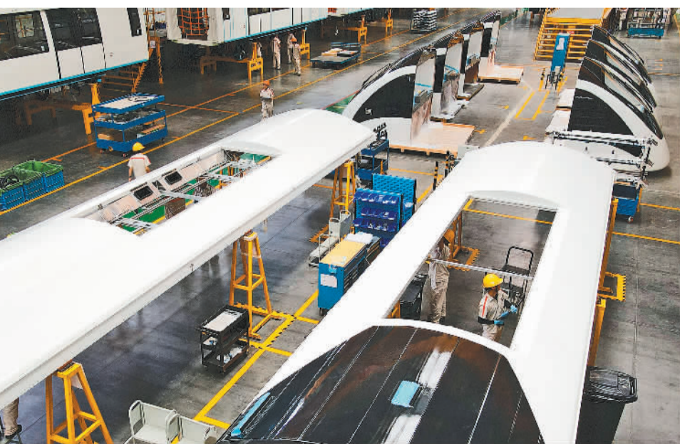
近日，安徽芜湖经开区中车浦镇阿尔斯通运输系统有限公司，工人在生产用于出口的单轨车辆。近年来，芜湖充分利用区位优势，重点打造航空航天、轨道交通等战略性新兴产业，促进产业链、创新链和人才链有机融合。

“实践中，确实存在失信被执行人既不履行义务，也不主动申请信用修复的情况。为此，我们坚持严格依法办案，积极主动作为，针对被列入失信名单又不申请信用修复的‘失声’企业，全面开展集中排查，逐一摸清失信企业的资产经营状况、履行能力意愿等情况，对符合信用修复条件的企业，依法及时予以修复。同时，也希望失信企业能够主动向法院申请信用修复，拿出信用修复的诚意和措施，共同推进这项工作。”张琛说。