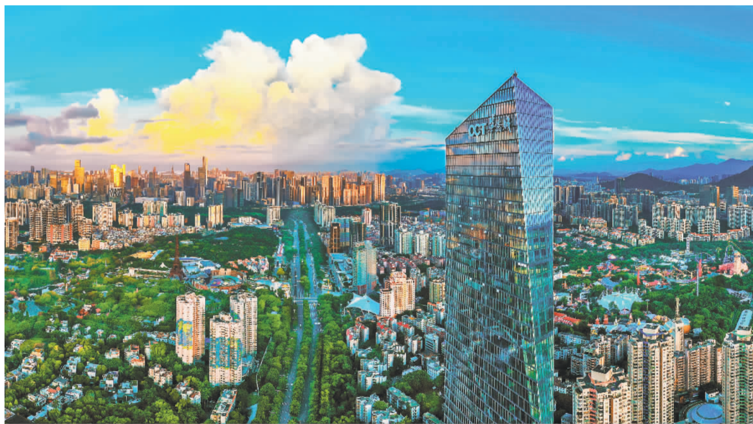
深圳华侨城旅游度假区

题”创意结合的襄阳华侨城奇幻度假区,深度融合文化艺术与海滨风情的深圳欢乐港湾,展现自然之美和魅力水乡生活情韵的江门古劳水乡度假区。