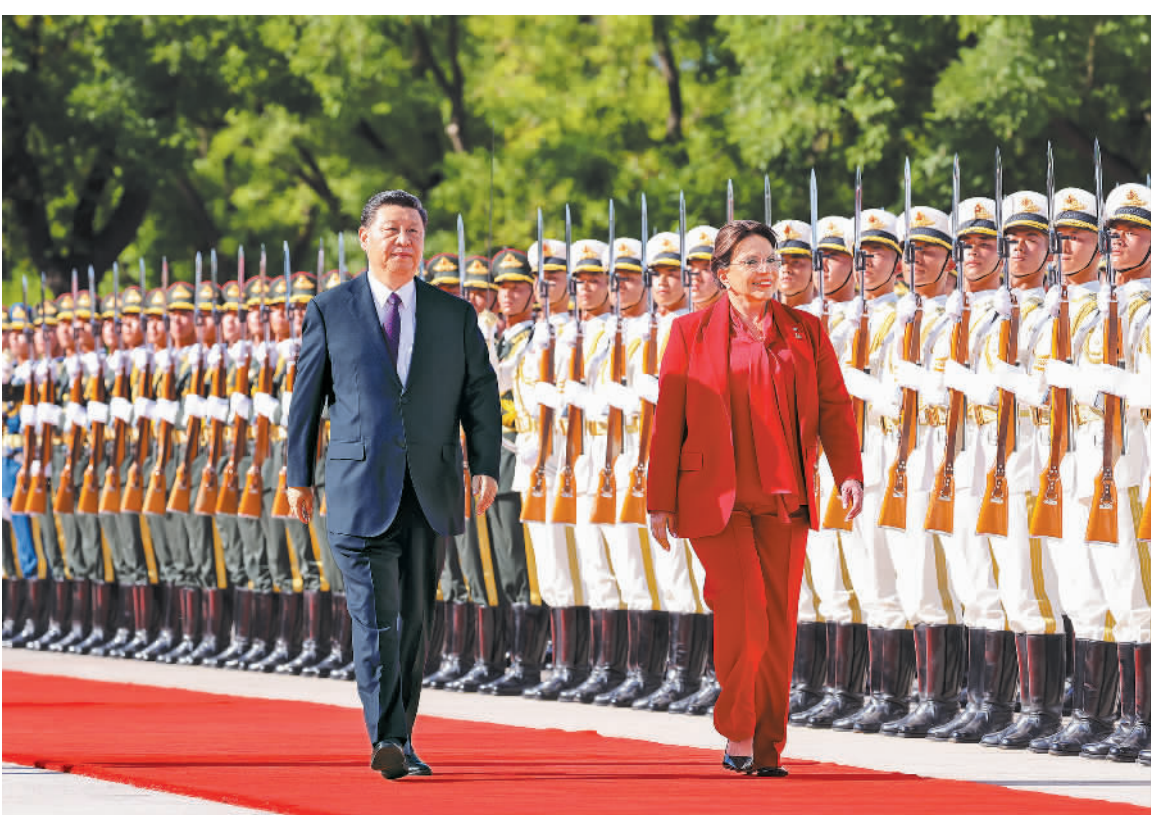
六月十二日下午，习近平在人民大会堂东门外广场检阅仪仗队。

新华社北京6月12日电(记者郑明达)6月12日下午，国家主席习近平在人民大会堂同来华进行国事访问的洪都拉斯总统卡斯特罗举行会谈。 习近平指出，卡斯特罗总统是首位对中国进行国事访问的洪都拉斯总统，你的访问开启了中洪关系新的历史篇章。今年3月中国同洪都拉斯建立外交关系以来，两国关系快速起步，开局良好，呈现出蓬勃活力和广阔前景。中洪建交功在当代，利在长远。中方将坚