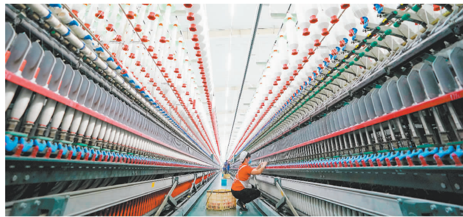
6月13日，江西万达美线业有限公司的工人在生产线上忙碌。今年以来，江西出台一系列举措，持续巩固纺织服装产业增长态势。预计到2023年底，全省纺织服装产业主营业务收入将达到5000亿元级，其中规模以上企业营业收入达到2500亿元。

“相关部门应考虑推出专门支持转型金融的政策工具，用较低成本支持符合标准的转型金融活动。”马骏建议，要让更多的金融机构拥有绿色发展的动力，监管部门也要有相应的配套政策来督促金融机构落实。