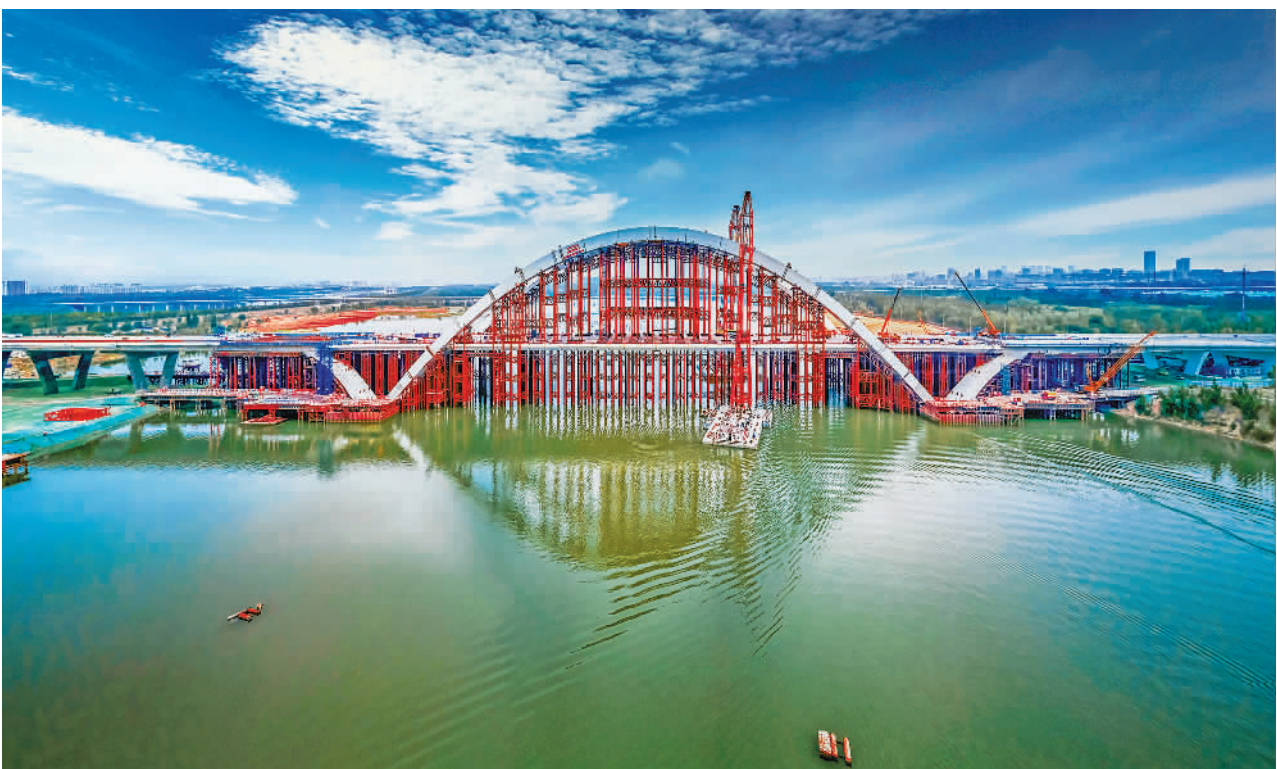
6月17日，京雄高速永定河畔京雄大桥合龙，刷新了北京桥梁最大跨度纪录。该桥由中铁上海局等单位参建，是京雄高速全线重难点和控制性工程。它的成功合龙，为京雄高速北京段年内全线通车奠定了坚实基础。