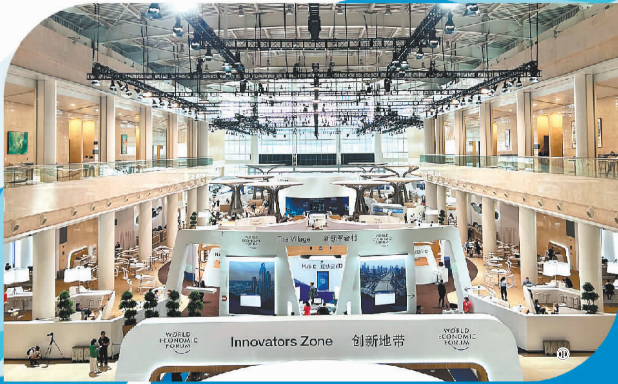
图① 第十四届夏季达沃斯论坛“新领军者村”现场。

经济增长,项目合作创造了更多就业,农业技术合作筑牢了粮食安全的基础……“一带一路”倡议在过去10年的实践中已经取得丰硕成果,未来将在推动全球经济复苏、引领绿色低碳发展、技术创新合作、提供综合性解决方案、推动可持续发展等方面作出更大贡献。”万喆说。