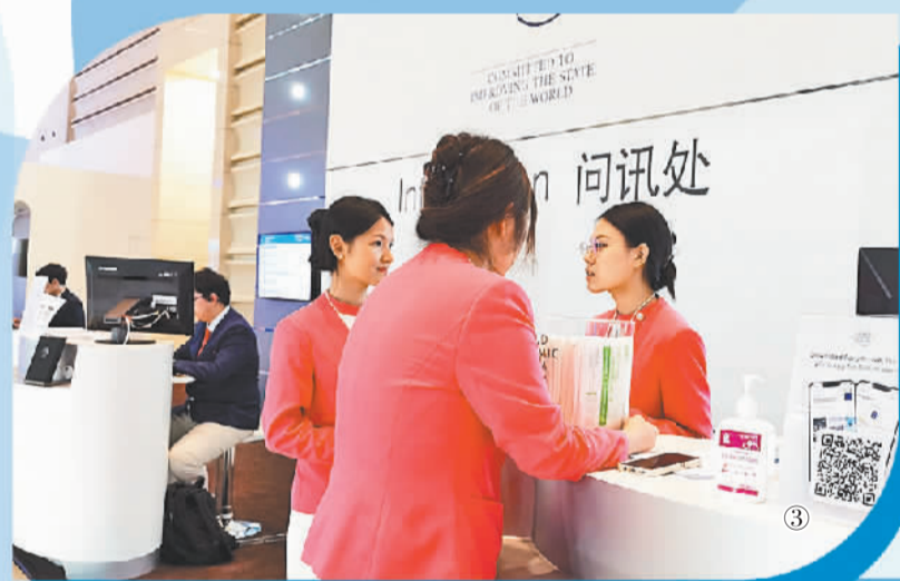
图③ 6月28日,在天津梅江会展中心,身着粉色服装的志愿者们正在为第十四届夏季达沃斯论坛提供服务。 本报记者 周琳