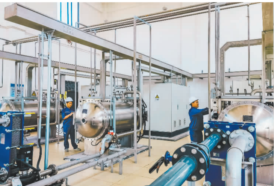
近日,在四川省眉山甘眉水务有限公司,水处理工程师正在调试设备。该公司的再生水厂及综合污水处理厂,承担着甘眉工业园区重点龙头企业及在建企业排放废水处理,实现100%达标排放,促进园区再生水循环利用。