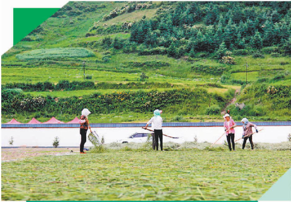
7月2日，甘肃定西市岷县寺沟镇群众在自家院落晾晒猫尾草。

定西是全国“道地药材”的重要产地，各类中药材种植面积达180万亩，年产量41.8万吨，均居全国地级市第一位。其中，三大主栽品种当归、党参、黄芪种植面积，分别占