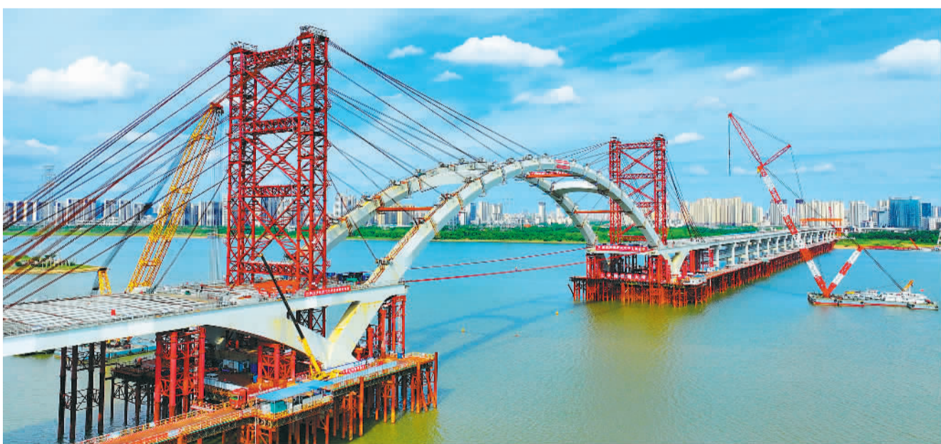
7月3日，江西省南昌市复兴大桥项目桥梁主梁工程正在加紧施工建设。作为南昌市第七座跨赣江桥梁，复兴大桥建成后能有效提升车辆过江通行效率，串联起南昌高新区、南昌县、红谷滩区九龙湖片区、新建区等区域，助力区域经济高质量发展。

为了放大庭院经济的示范效应，定西市因地制宜拓展特色种植、特色养殖、特色手工、休闲旅游等发展类型，立足乡村特色资源，开发具有鲜明地域特点、民族特色、乡土特征的特色产品，实现庭院经济与休闲农业、民宿旅游等融合发展，持续增加群众经营性收入。根据计划，到2023年年底，定西市将发展有特色、可复制、带动效应显著的庭院经济示范户650户以上。