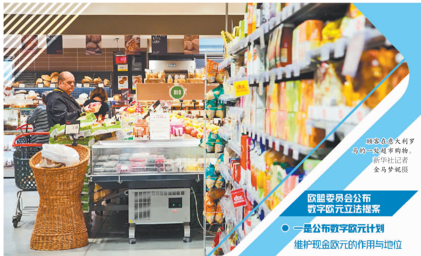
顾客在意大利罗马的一处超市购物。

近日,欧盟委员会如期公布数字欧元立法提案,希望减少欧洲零售支付市场的碎片化,同时促进竞争,这预示着数字欧元时代即将到来。欧洲央行表示欢迎欧委会的相关提案,期待与其他欧盟组织继续合作开发数字欧元,以确保欧盟跟上数字时代步伐。包括数字欧元在内的数字经济发展,可能给世界带来意想不到的新变化,不过也可能出现诸多难以预料的难题。但不管怎样,全球众多中央银行已进入开发数字货币的不同阶段,未来将共同开启数字经济的新时代。