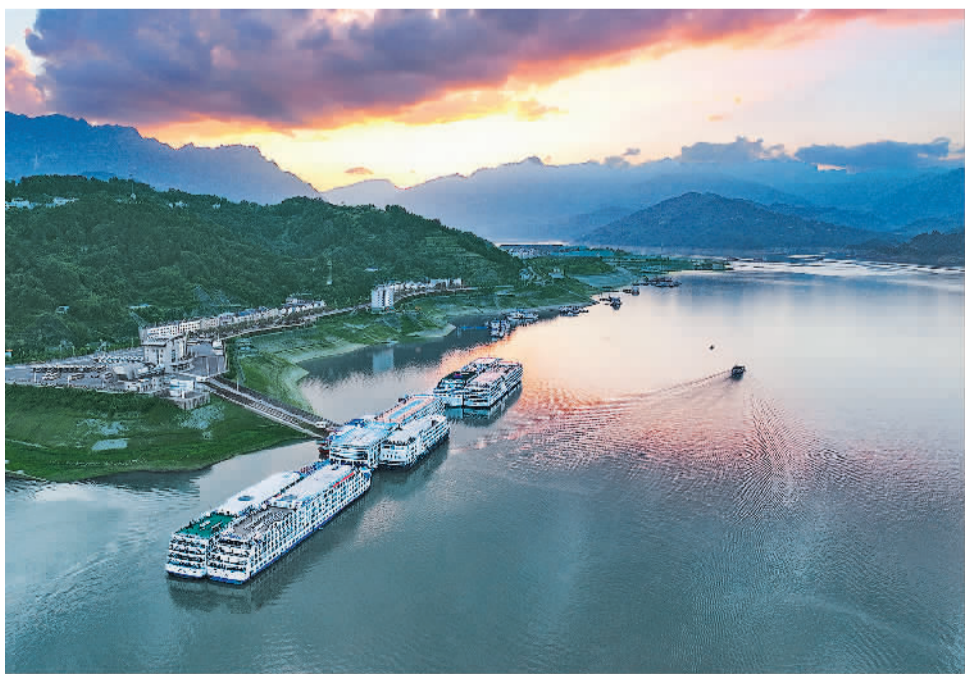
三峡游轮停靠在湖北省宜昌市秭归县旅游港口。据悉,2023年上半年长江三峡游轮共发船2260艘次,为2019年同期90%,完成客运量59.76万人,为2019年同期的122.56%,三峡旅游已基本恢复至2019年水平。

白云区也正推动工业互联网数字化赋能化妆品企业,并已经落地白云美湾国际化妆品研究院,加快促进化妆品领域科技成果产业化。另外,白云区正深入对接工业互联网技术服务商,力争形成一套工业互联网“白云美湾”标准。