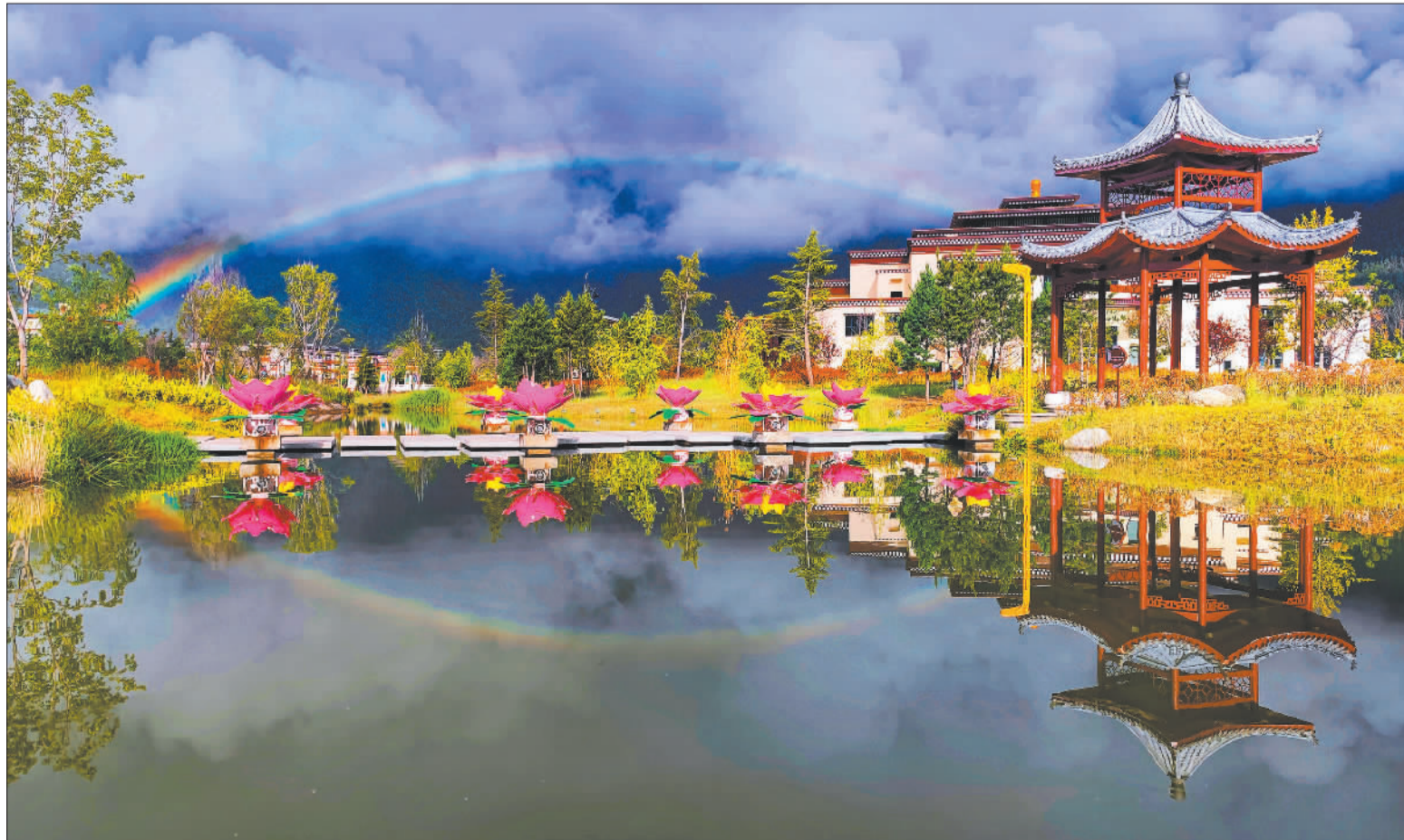
►林芝市巴宜区工布公园水清岸绿、生态和美,吸引了不少市民前来休闲观光、健身娱乐。