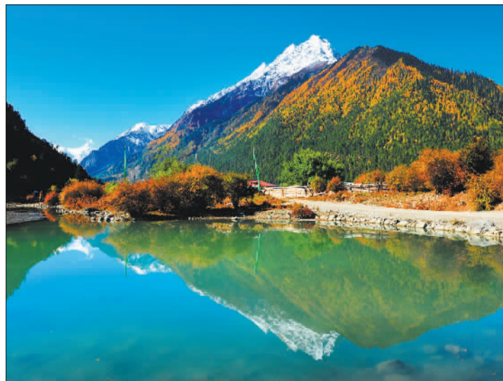
▲西藏自治区林芝市波密县松宗镇朗秋村美景如画。近年来,该县依托波密冰川等资源,借助村落发展乡村旅游,着力打造西藏的康养和绿色旅游目的地。

你的空气 带着花的气息 带着云的纯洁 带着叶的色彩 在山川中歌唱 在大地上澎湃 让每一片森林 每一株小草 每一朵山花 无拘无束地展现 生态林芝的风采