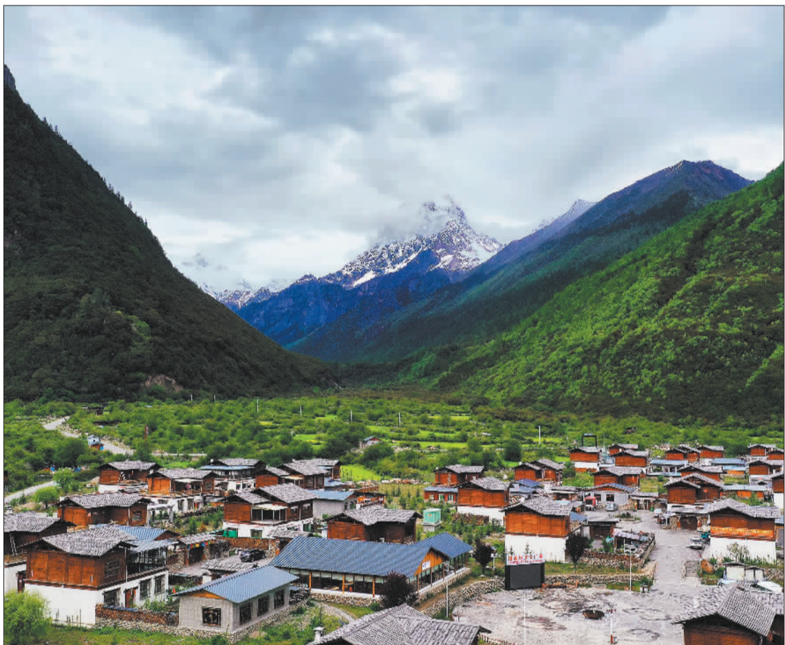
▼林芝市工布江达县错高乡错高村村容整洁、环境宜人,藏式新民居错落有致。