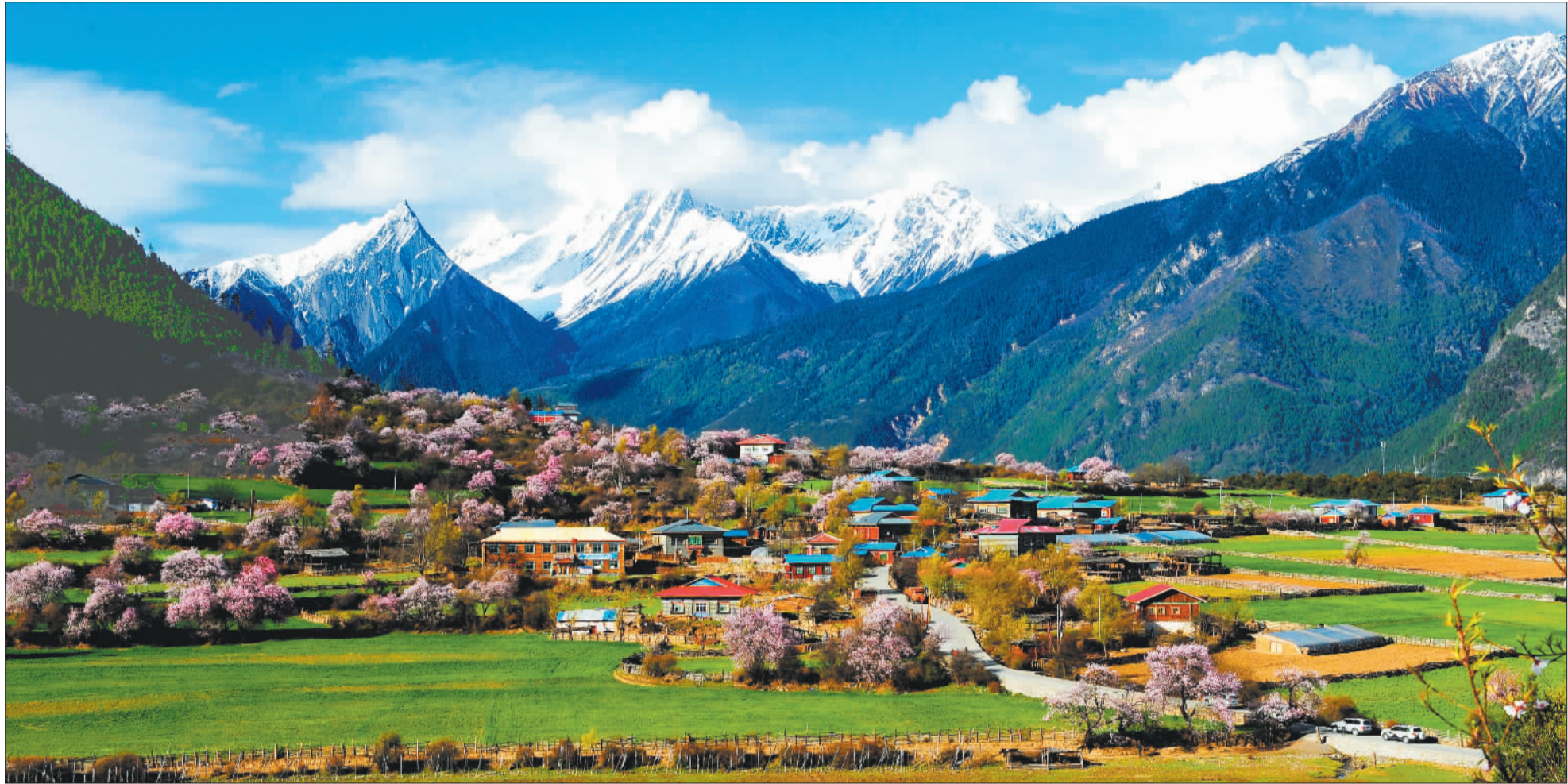
▲西藏林芝市波密县嘎朗村,连绵的雪峰、成片的桃花、碧绿的青稞田、美丽的藏族民居,构成一幅生态高原美景。