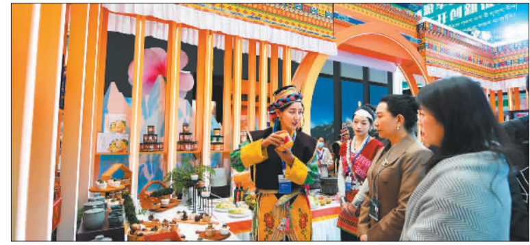
▶游客在第五届藏博会林芝馆内了解林芝特产。近年来,林芝市积极推动企业开拓市场,拓展经贸交流渠道。