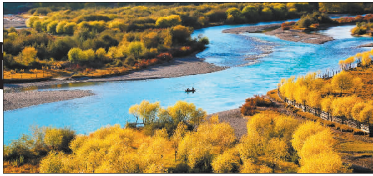
▲林芝市巴宜区雅尼湿地,生态宜人,美景如画。