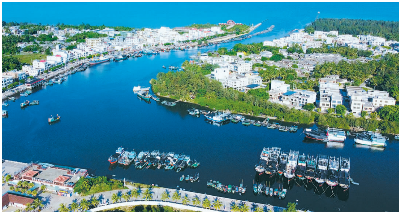
7月25日,千艘渔船停泊在海南省琼海市潭门渔港,有序休渔。潭门是南海渔港的第一大门,也是西、南、中、东沙群岛作业渔场后勤补给基地和深远海鱼货集散销售基地。休渔期内,渔民精蓄锐,织网补网,为开网捕鱼作准备。

强和行业龙头企业数量已超去年。本届进博会继续由国家综合展、企业商业展等部分组成。作为进博会的重要组成部分,前两届国家综合展线上举办,今年将回归线下,展现各国科技创新等内容。同时,中国馆展览面积也扩容至2500平方米,规模为历届之最。