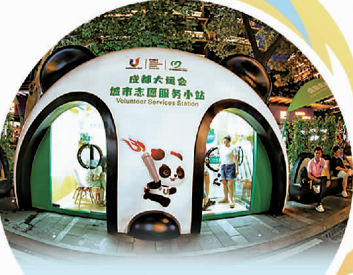
中国电建水电一局青年志愿服务队在成都市玉林西路的城市志愿服务站提供服务。

作为最具活力和幸福感的城市之一，成都正借大运之机遇，向世界分享中国式现代化的万千气象。