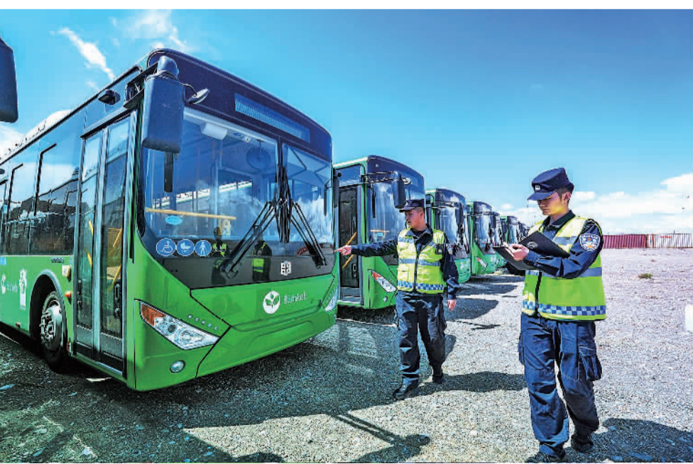
今年以来，山东聊城经济技术开发区通过一对一精准服务，助力企业开拓国际市场，今年上半年完成进出口30.5亿元，同比增长10%。其中，中通客车与吉尔吉斯斯坦签订了1000台清洁能源客车订单，创下中国对吉尔吉斯斯坦客车出口的新纪录。图为新疆吐尔斯坦出境边防检查站执勤民警对即将出口的新能源客车进行核查。

今年以来，上海累计招商签约亿元以上重点项目超过700个、总投资超过7000亿元。上半年，重大工程完成投资1100.4亿元，同比增长62.3%，12个正式项目开工建设，3个预备项目提前开工，7个项目基本建成。与此同时，民间投资也企稳回升。上半年，上海民间投资