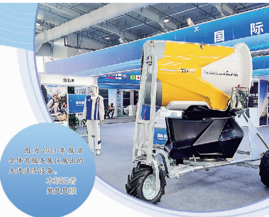
图为2023年服贸会体育服务展区展出的先进造雪设备。

又到秋高气爽时，一年一度的中国国际服务贸易交易会如期而至。9月2日至6日，以“开放引领发展，合作共赢未来”为主题的2023年服贸会在京举行。这是我国全面恢复线下展会以来的首届服贸会，肩负着更好地扩大开放、深化合作、引领创新的使命。